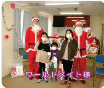
ワールドメイト様