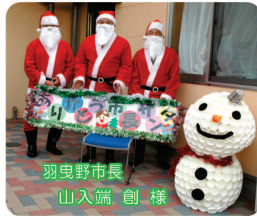
羽曳野市長 山入端 創 様